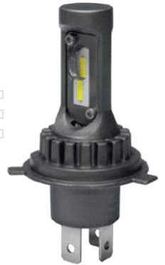
XL H4 CSP