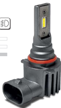
XL HB4 CSP