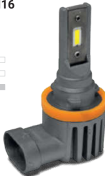
XL H8 CSP