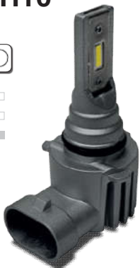
XL HB3 CSP