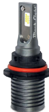
XL HB5 CSP