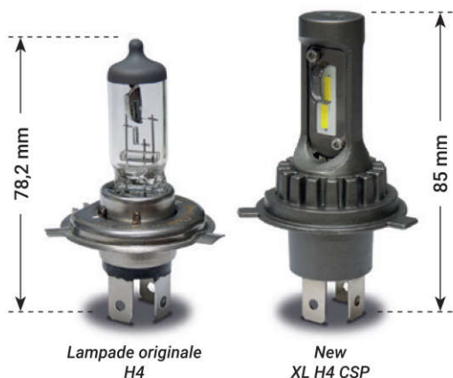
Lampade originale H4

Con la nuova gamma Sirius , siamo riusciti in un'impresa impossibile: realizzare lampade LED per fari di proiezione senza alcuna centralina esterna, senza ventola e senza dissipatore . Il risultato è una lampada con dimensioni pressoché identiche ad una normale lampada ricambio alogena.