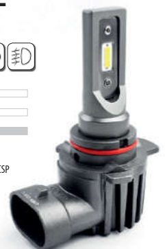
XL HIR2 CSP