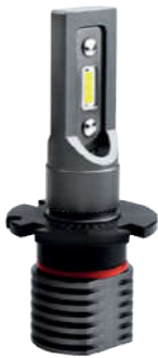
XL D CSP