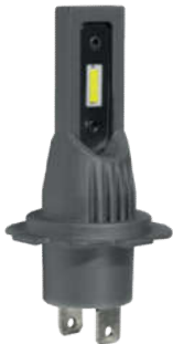
XL H7 CSP