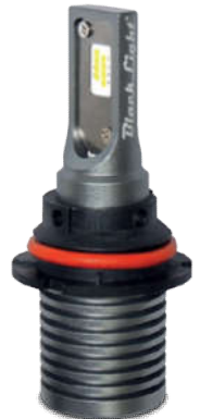
XL HB1 CSP